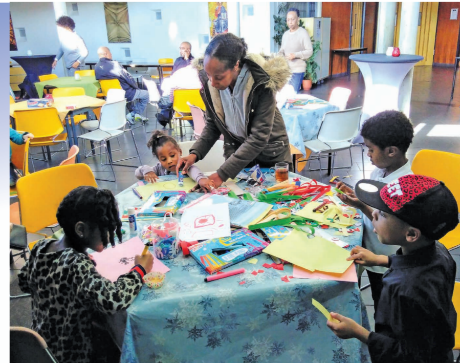
▲ Knutselende kinderen in De Nieuwe Stad.

In het najaar van 2017 werd in Zuidoost het plan opgevat om met de kerken die samen De Nieuwe Stad (Luthulplein) delen een gezamenlijke inloopmiddag te beginnen. In december - precies tijdens een heftige sneeuwstorm - ging deze inloop van start. Lutherse, Protestantse en Katholieke vrijwilligers lieten zich niet weerhouden door de storm en ook de eerste bezoekers verrijkten ons gezelschap. De sfeer was warm en gezellig. Vanuit de Katholieke gemeenschap werd een workshop kerststukjes maken verzorgd. De Protestanten droegen zorg voor live muziek. En de Lutheranen verzorgden een kerstverhaal in bingovorm. "Thuis hebben we geen schaar en lijn," vertelde een meisje uit een ongedocumenteerd gezin. Wat vond ze het heerlijk om in De Nieuwe Stad de hele middag te knutselen. Na de voorzichtige maar prachtige start in december zijn ook andere kerken betrokken geraakt. Vanuit de Ghanese Baptisten gemeenschap raakte een actieve vrijwilliger betrokken die een nieuwe facebookpagina voor ons maakte. De pinkstergemeente Treasures verzorgt sinds januari elke maand een warme maaltijd voor de bezoekers. "Ik realiseer me nu pas hoe bijzonder het is dat we met zoveel kerken samenwerken," zei één van de vrijwilligers laatst. Door de diversiteit in ons team kan ook een diversiteit aan bezoekers zich bij ons welkom voelen!"