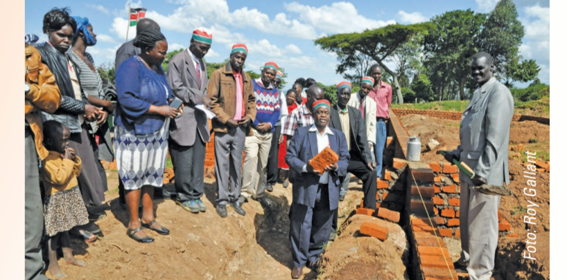
▲ Eerstesteenlegging schoolproject African Divine Church Kenia.