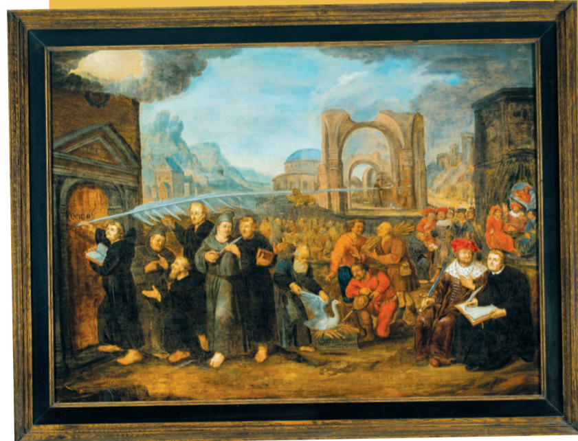
▲ Droom van de keurvorst door Bartholomeus Breenbergh.