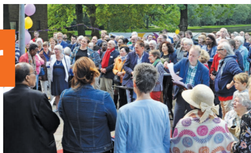
▲ Veel belangstelling bij opening Augustanahof.